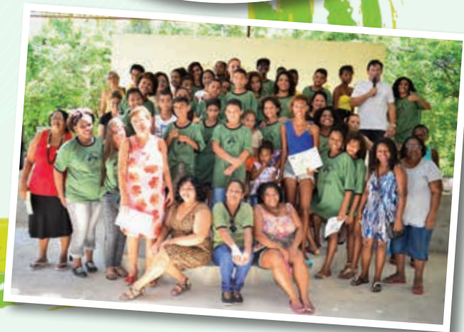
FORMATURAS DO PROGRAMA DE INCLUSÃO DIGITAL