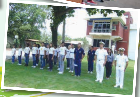
FORMATURAS DO PROGRAMA PLEITEAR NAS UNIDADES MILITARES