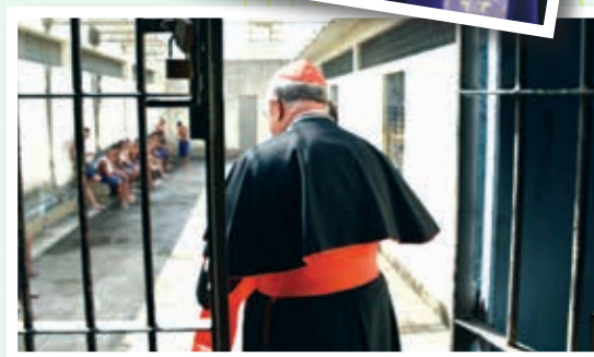
Acima, Dom Orani João Tempesta, Cardeal Arcebispo Metropolitano de São Sebastião do Rio de Janeiro, visita os jovens infratores para celebrar a Eucaristia e levar-lhes conforto, inclusive dentro das celas