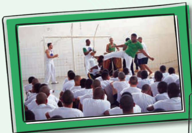
Acima, jovens internos assistem à apresentação de um grupo de capoeira; à direita, os internos recebem a visita da imagem de São Sebastião, Padroeiro da capital fluminense