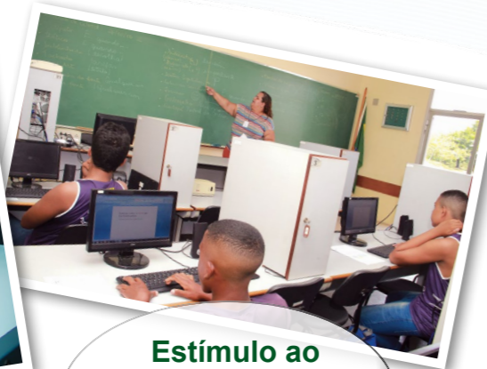
Estímulo ao protagonismo infantojuvenil