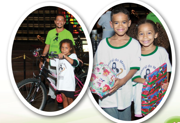
Natal das crianças