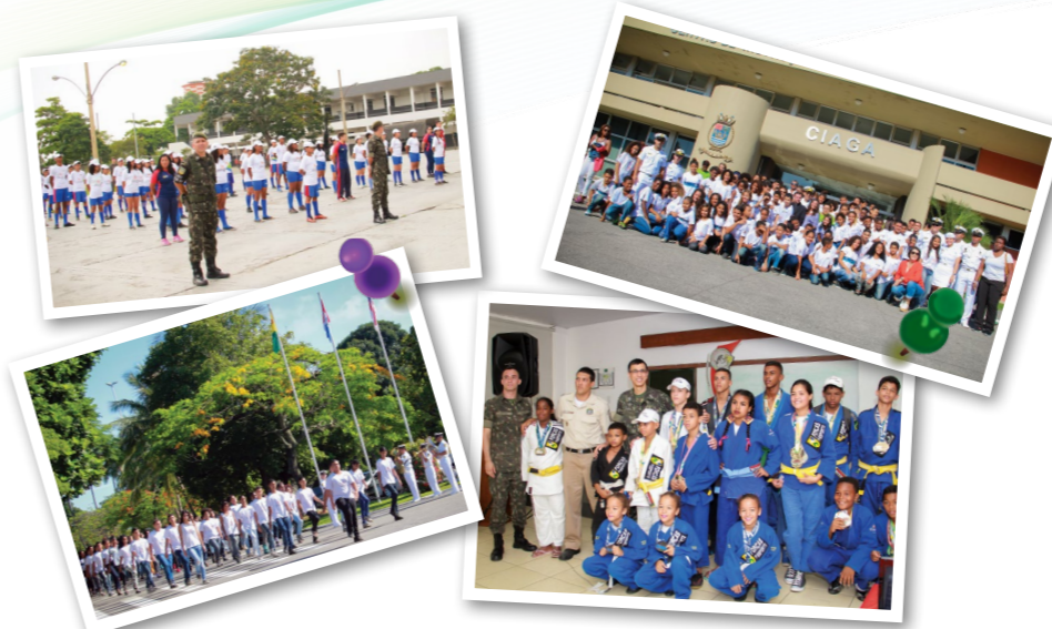
Formatura nas Unidades Militares