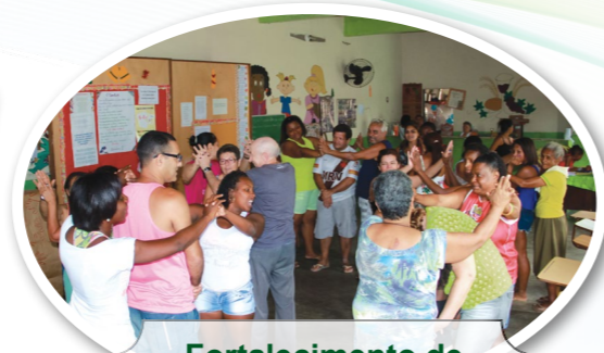
Fortalecimento de vínculos familiares e comunitários