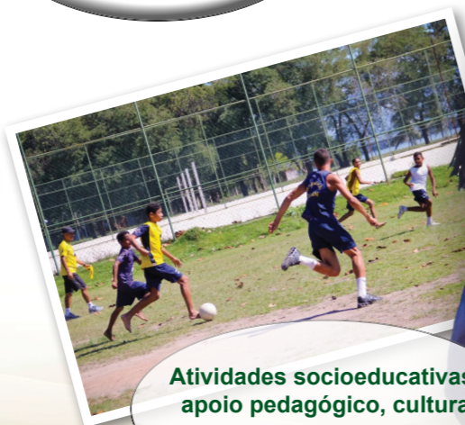
Atividades socioeducativas: apoio pedagógico, cultura digital, esporte e lazer