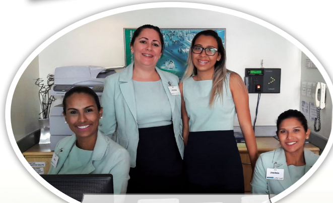
Inserção de jovens no mundo do trabalho