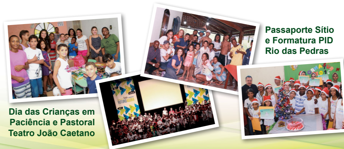
Dia das Crianças em Paciência e Pastoral Teatro João Caetano