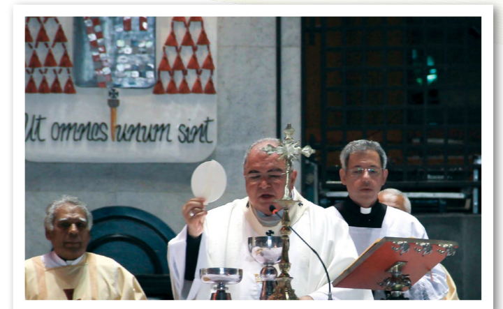
Cardeal Dom Orani Tempesta celebra Missa pela Pastoral do Menor